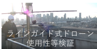
ラインガイド式ドローン 使用性等検証